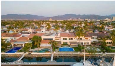
MLS Vallarta Nayari Compostela