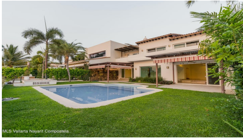
MLS Vallarta Nayari Compostela