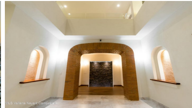
MLS Vallarta Nayari Compostela