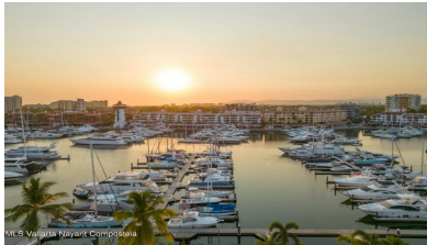
MLS Vallarta Nayari Compostela