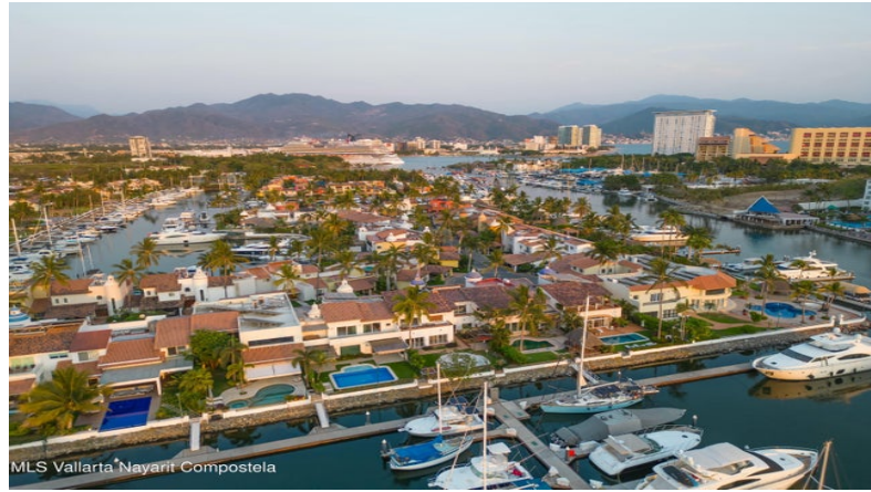
MLS Vallarta Nayari Compostela