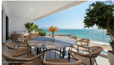
MLS Vallarta Nayarit Compostela