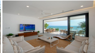
MLS Vallarta Nayarit Compostela