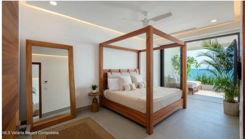
MLS Vallarta Nayarit Compostela