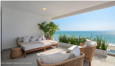
MLS Vallarta Nayarit Compostela