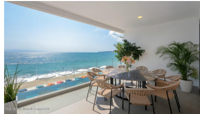
MLS Vallarta Nayarit Compostela