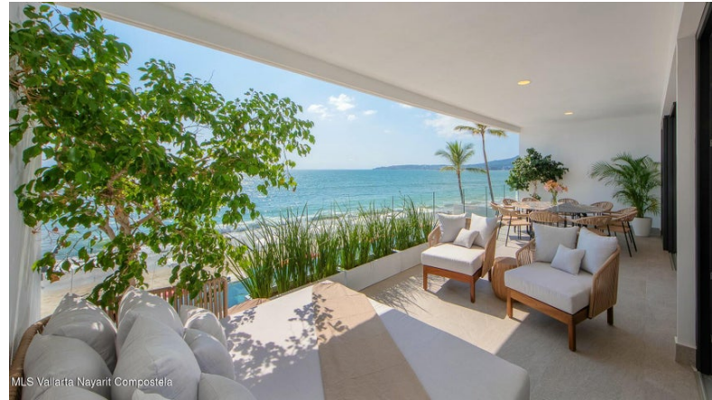
MLS Vallarta Nayarit Compostela