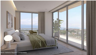
MLS Vallarta Nayari Compostela