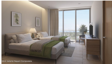
MLS Vallarta Nayari Compostela