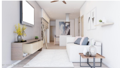
MLS Vallarta Nayarit Compostela