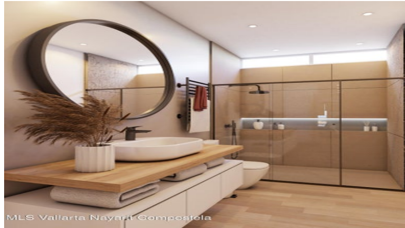
MLS Vallarta Nayarit Compostela