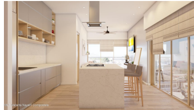
MLS Vallarta Nayarit Compostela