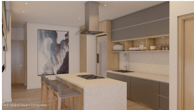
MLS Vallarta Nayarit Compostela