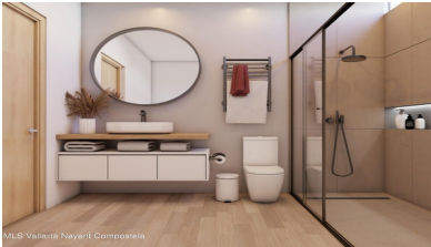
MLS Vallarta Nayarit Compostela