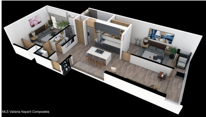
MLS Vallarta Nayarit Compostela