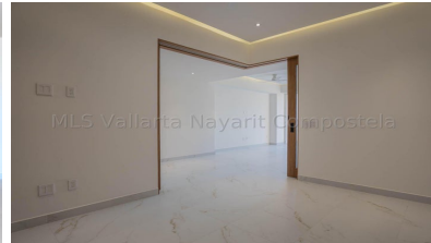
MLS Vallarta Nayarit Compostela