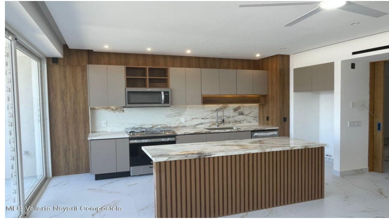
MLS Vallarta Nayarit Compostela