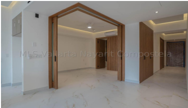
MLS Vallarta Nayarit Compostela