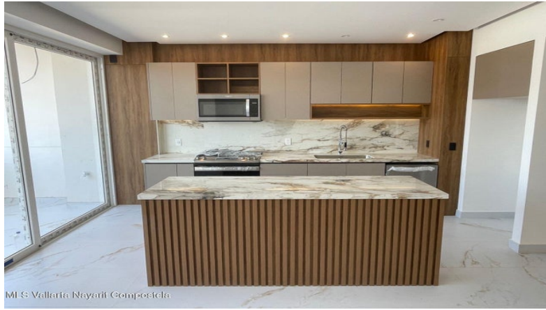
MLS Vallarta Nayarit Compostela