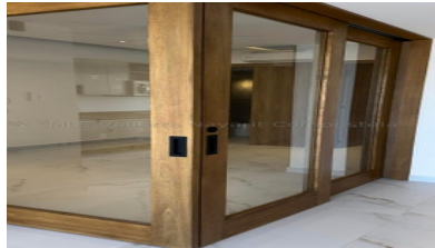
MLS Vallarta Nayarit Compostela