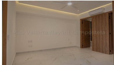
MLS Vallarta Nayarit Compostela