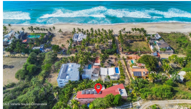
MLS Vallarta Nayant Compostela