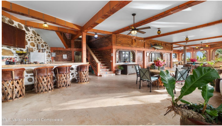
MLS Vallarta Nayant Compostela