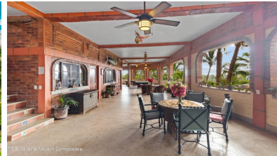
MLS Vallarta Nayant Compostela