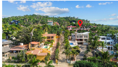
MLS Vallarta Nayant Compostela