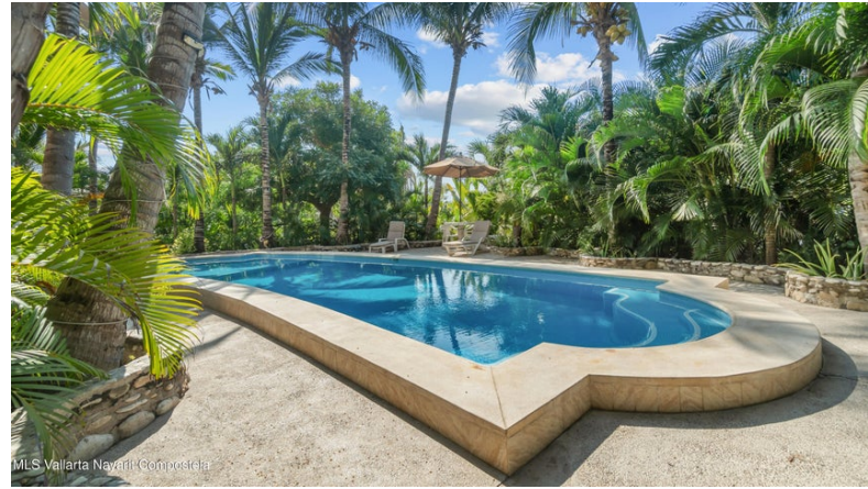
MLS Vallarta Nayant Compostela