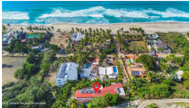
MLS Vallarta Nayant Compostela