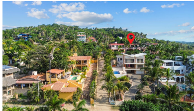
MLS Vallarta Nayant Compostela