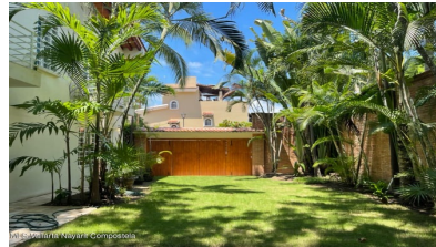
MLS Vallarta Nayari Compoctela