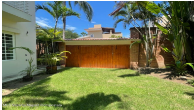
MLS Vallarta Nayari Compoctela