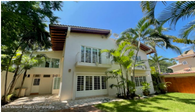
MLS Vallarta Nayari Compoctela