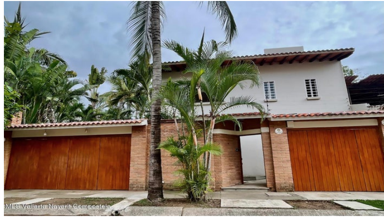
MLS Vallarta Nayari Compoctela