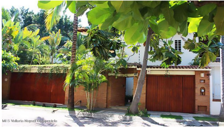
MLS Vallarta Nayari Compoctela