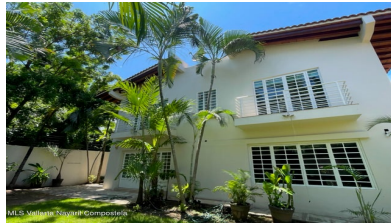
MLS Vallarta Nayari Compoctela