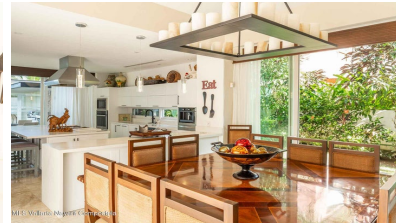
MLS Vallarta Nayarit Compostela