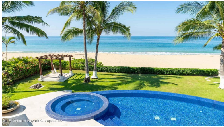
MLS Vallarta Nayarit Compostela