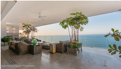
MLS Vallarta-Nayarit Compostela