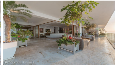
MLS Vallarta-Nayarit Compostela