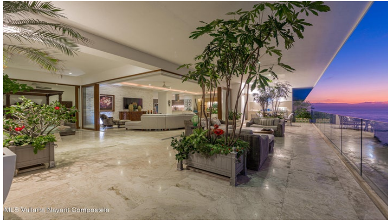
MLS Vallarta-Nayarit Compostela