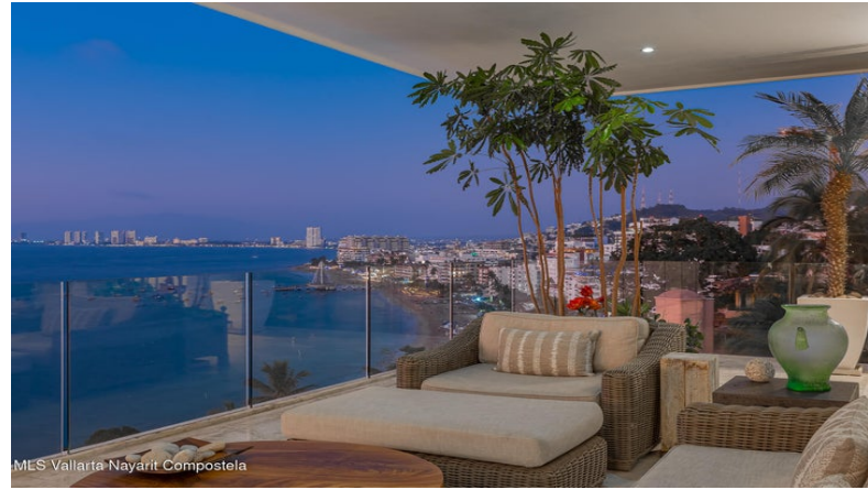
MLS Vallarta-Nayarit Compostela