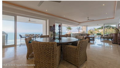
MLS Vallarta-Nayarit Compostela