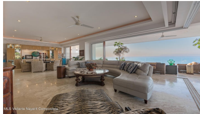
MLS Vallarta-Nayarit Compostela