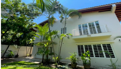
MLS Vallarta Nayarit Compoctela