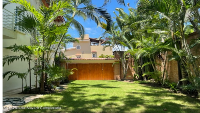
MLS Vallarta Nayarit Compoctela