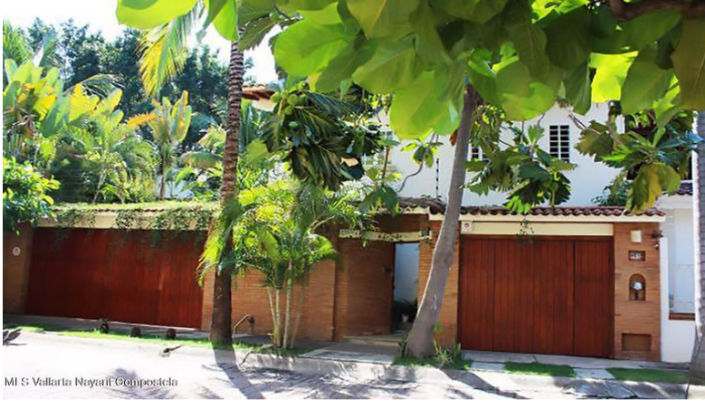
MLS Vallarta Nayarit Compoctela