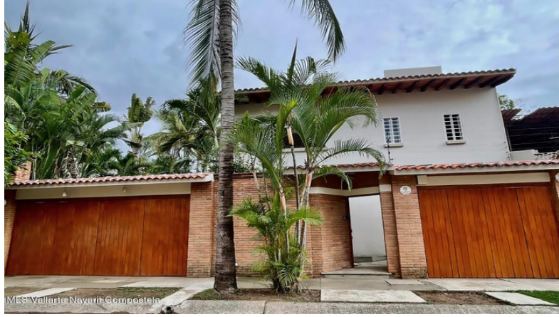
MLS Vallarta Nayarit Compoctela