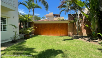
MLS Vallarta Nayarit Compoctela