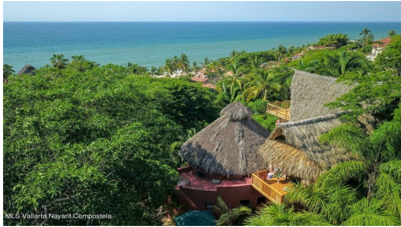
MLS Vallarta Nayari Compostela