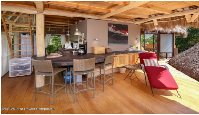
MLS Vallarta Nayari Compostela