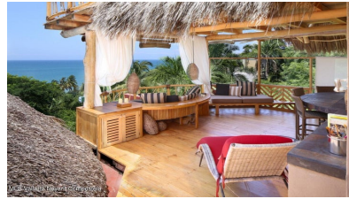
MLS Vallarta Nayari Compostela