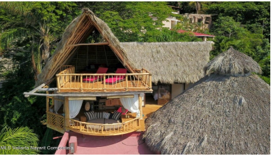
MLS Vallarta Nayari Compostela