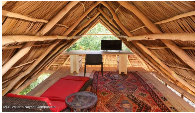
MLS Vallarta Nayari Compostela