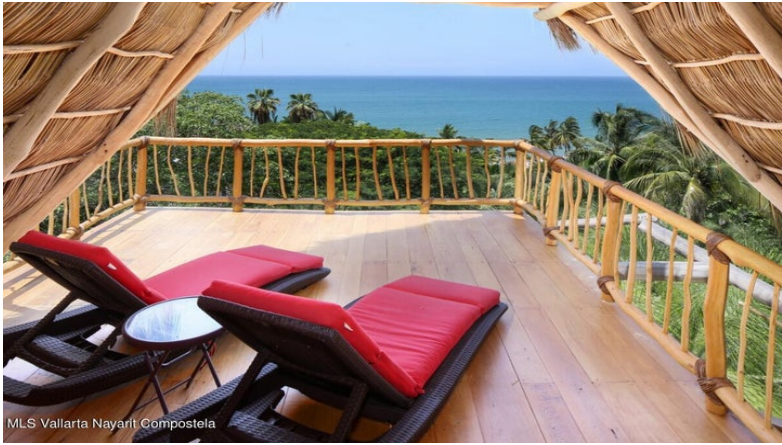
MLS Vallarta Nayari Compostela