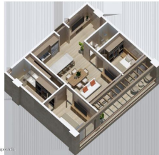
MI S Vallarta Nayarit Compostela