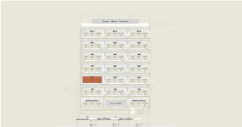
MI S Vallarta Nayarit Compostela