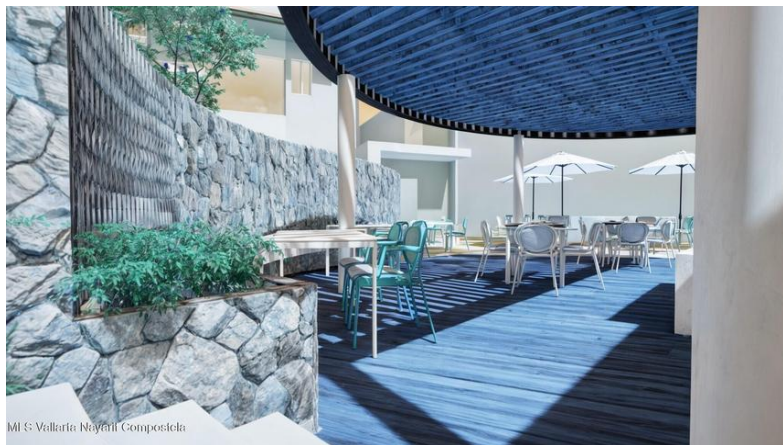
Mi S: Vallarta Nayari Compostela

ESCALA: 1:75 DESARROLLADORA: VENTAS: DISEÑO: