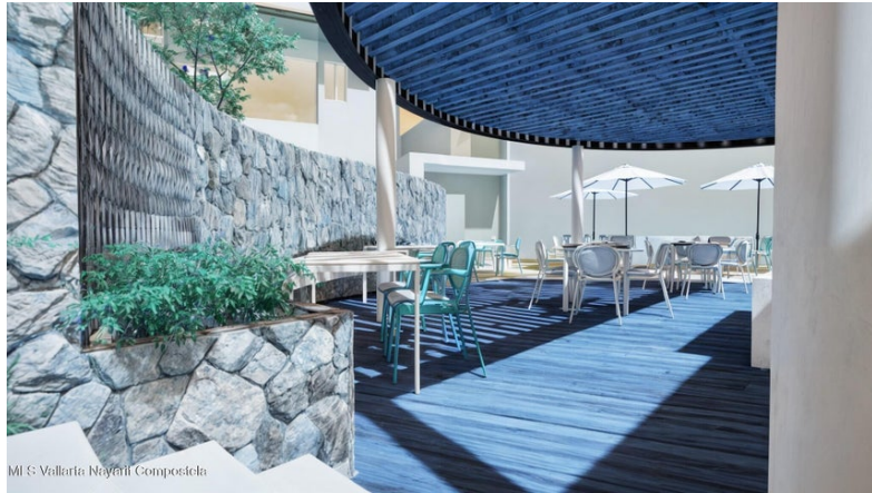
Mi S-Vallarta Naymii Compostela