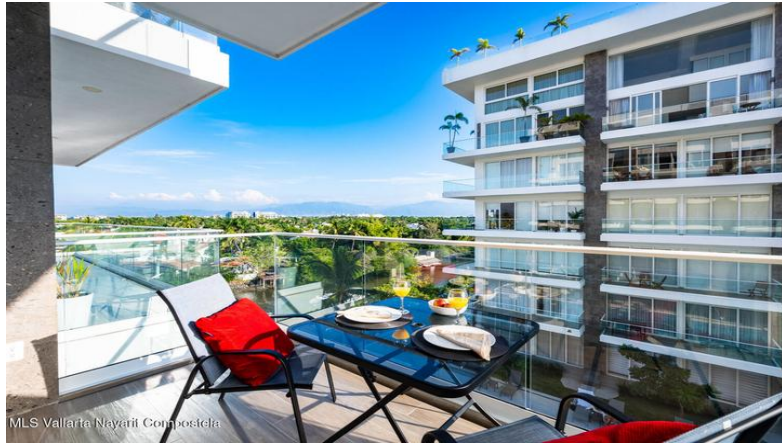
MLS Vallarta Nayarit Compoetela