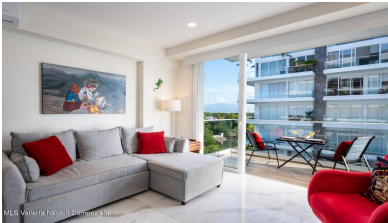
MLS Vallarta Nayarit Compoetela