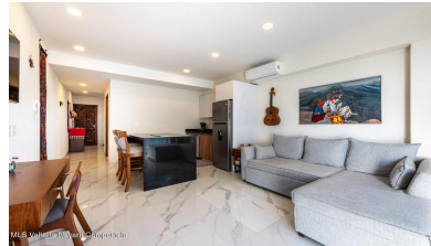
MLS Vallarta Nayarit Compoetela