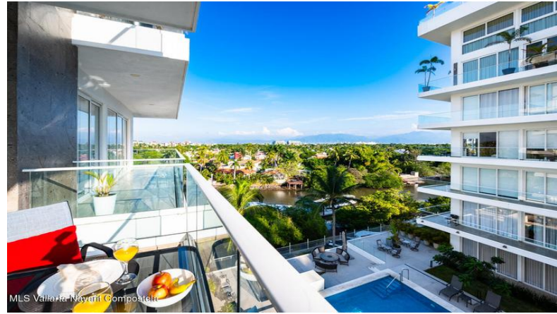
MLS Vallarta Nayarit Compoetela