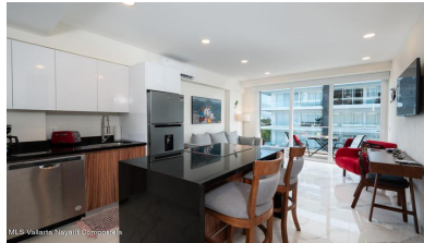
MLS Vallarta Nayarit Compoetela