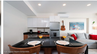
MLS Vallarta Nayarit Compoetela