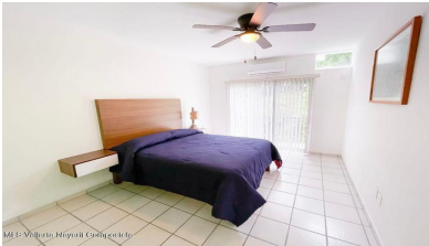
MI S Vallarta Nayariit Compostela