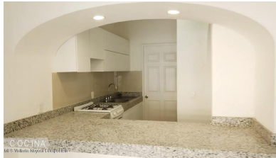
COCINA MI S Vallarta Nayariit Compostela