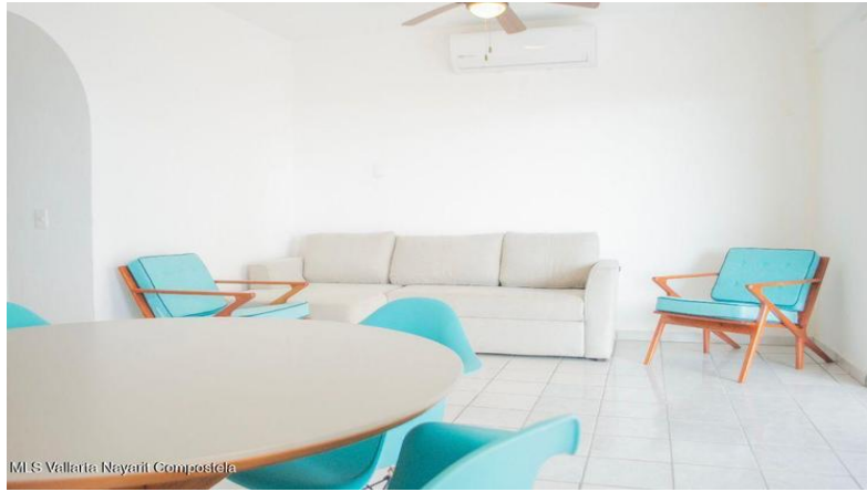
MI S Vallarta Nayariit Compostela