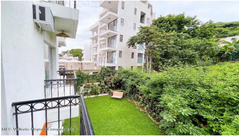
MI S Vallarta Nayariit Compostela