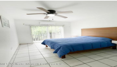
MI S Vallarta Nayariit Compostela