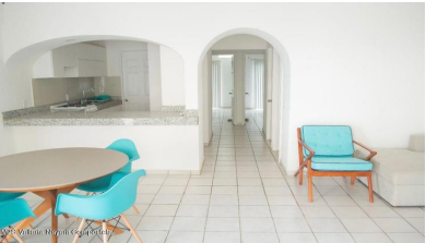
MI S Vallarta Nayariit Compostela