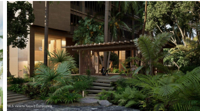
MI S Vallarta Nayari Compostela