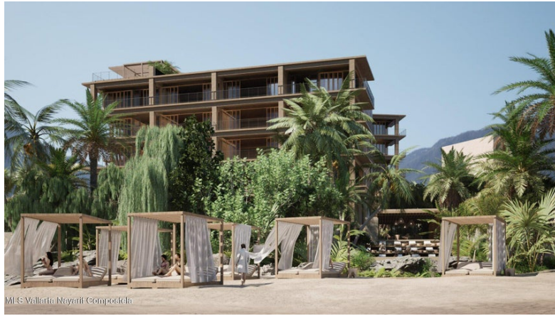
MI S Vallarta Nayari Compostela