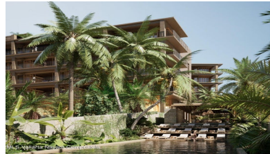
MI S Vallarta Nayari Compostela