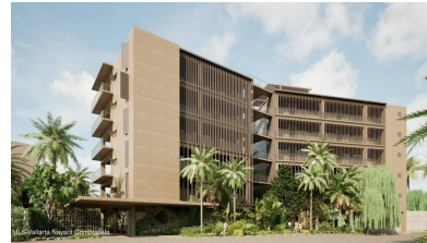
MI S Vallarta Nayari Compostela