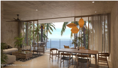
MI S Vallarta Nayari Compostela