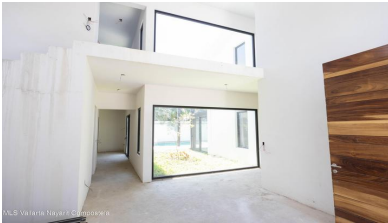
MIS Vallarta Nayarit Compostela