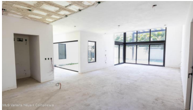
MIS Vallarta Nayarit Compostela