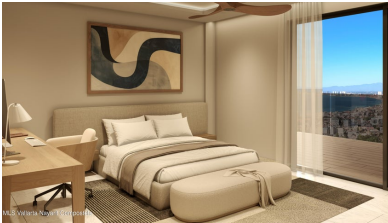
MI S Vallarta Nayarit Compostela