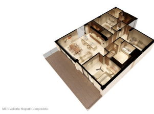
MI S Vallarta Nayarit Compostela