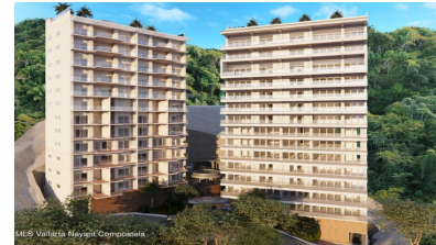
MI S Vallarta Nayarit Compostela