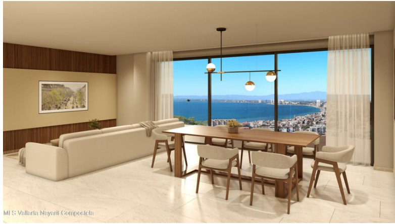
MI S Vallarta Nayarit Compostela