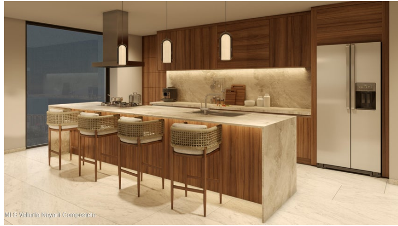
MI S Vallarta Nayarit Compostela