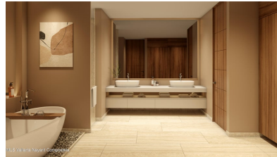
MI S Vallarta Nayarit Compostela