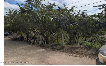
MI S Vallarta Navarri Compostela