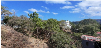
MI S Vallarta Navarri Compostela