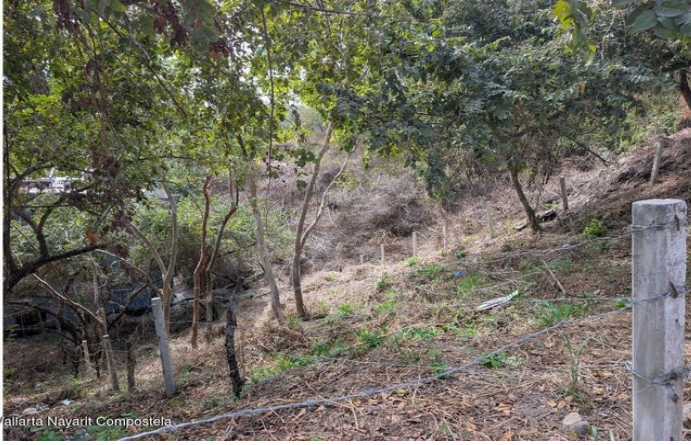
MI S Vallarta Navarri Compostela