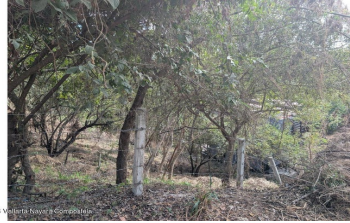
MI S Vallarta Navarri Compostela