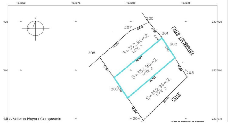
MI S Vallarta Navarri Compostela