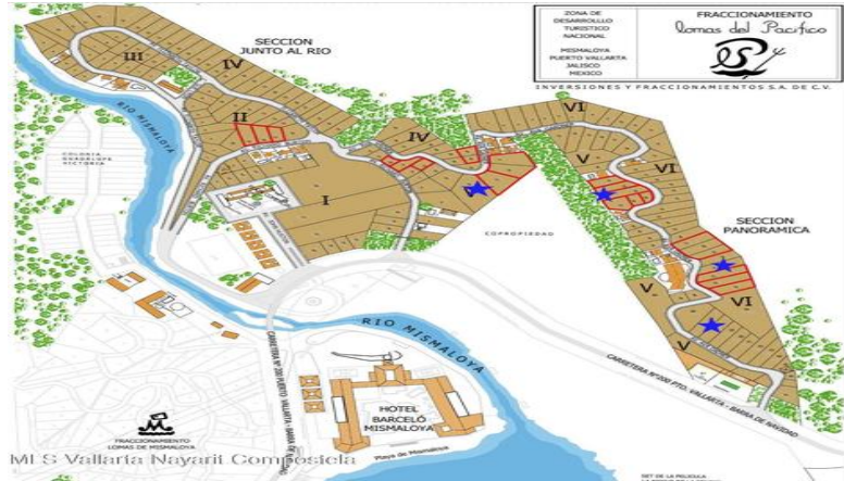
MI S Vallarta Nayarit Compostela

LOMAS DEL PACÍFICO NATURE'S RETREAT Lote 18 M-V 825.00 m 2 Uso de Suelo: H1 (5)