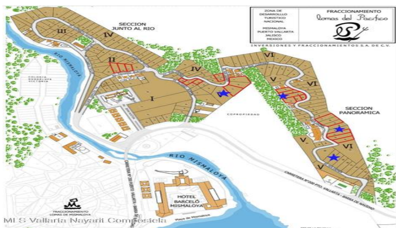
MI S Vallarta Nayarit Compostela

LOMAS DEL PACÍFICO NATURE'S RETREAT Lote 18 M-II 517.18 m 2 Uso de Suelo: H1 (5)