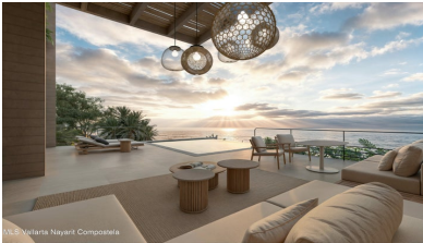
M/S Vallarta Nayarit Compostela