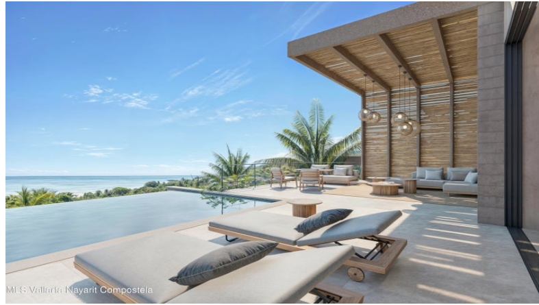
M/S Vallarta Nayarit Compostela