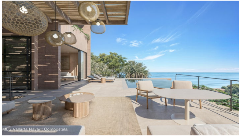
M/S Vallarta Nayarit Compostela