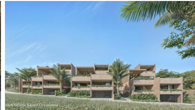
M/S Vallarta Nayarit Compostela