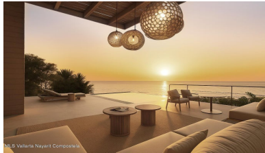
M/S Vallarta Nayarit Compostela