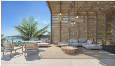
M/S Vallarta Nayarit Compostela