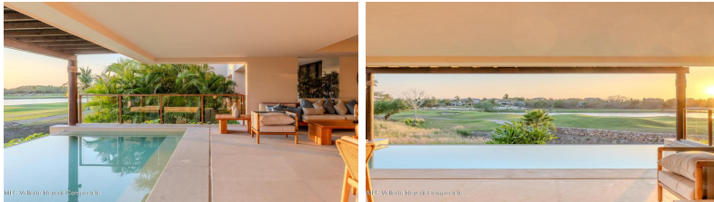
M/S Vallarta Nayarit Compostela