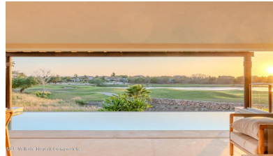
M/S Vallarta Nayarit Compostela