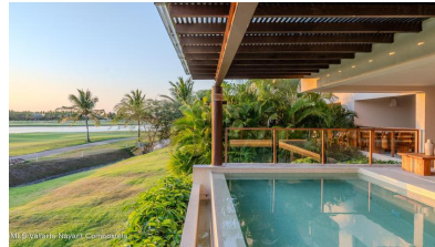
M/S Vallarta Nayarit Compostela