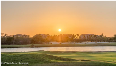
M/S Vallarta Nayarit Compostela