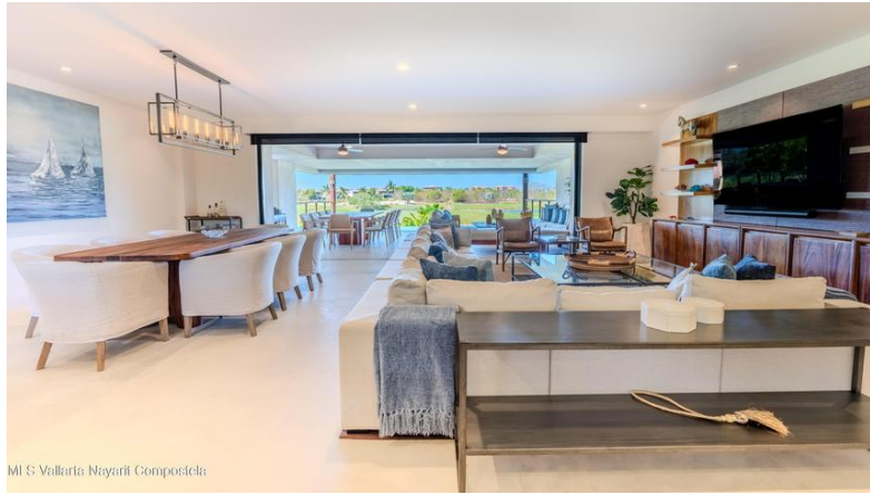
M/S Vallarta Nayarit Compostela