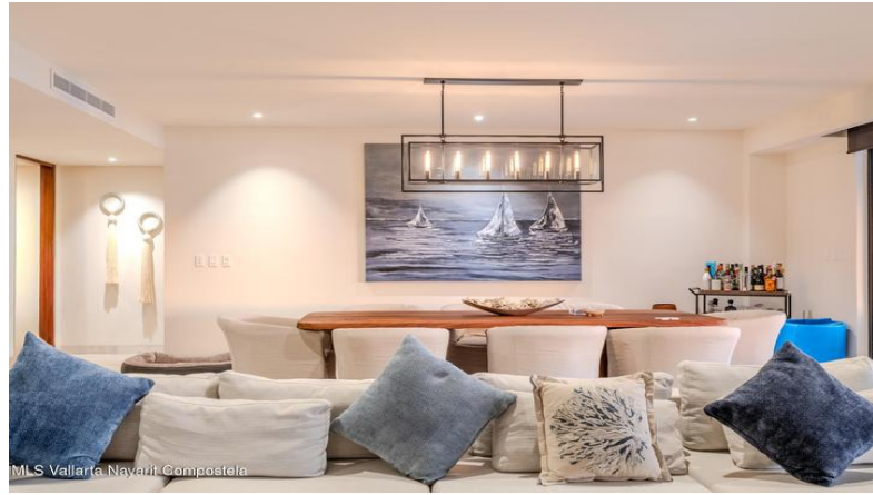
M/S Vallarta Nayarit Compostela