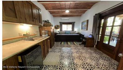
MI S Vallarta Nayariit Compostela