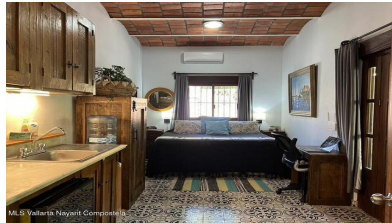
MI S Vallarta Nayariit Compostela