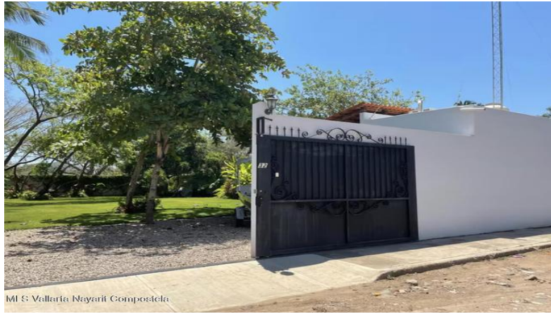
MI S Vallarta Nayariit Compostela