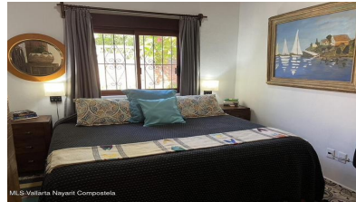
MI S Vallarta Nayariit Compostela