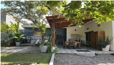
MI S Vallarta Nayariit Compostela