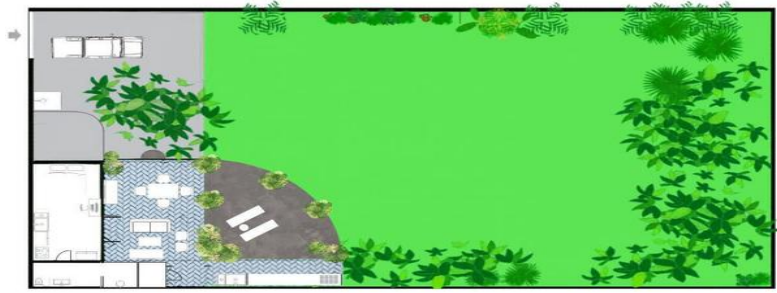
MI S Vallarta Nayariit Compostela