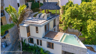
MIS Vallarta Nayait Compostela