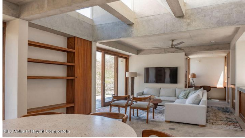
MIS Vallarta Nayait Compostela