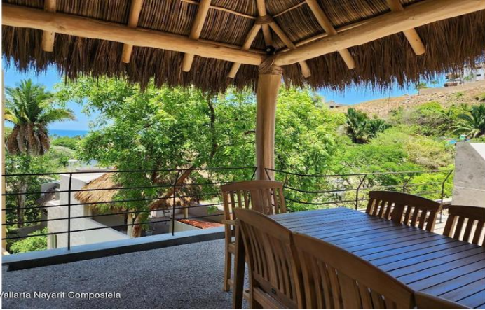
MIS Vallarta Nayait Compostela