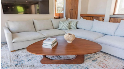
MIS Vallarta Nayait Compostela