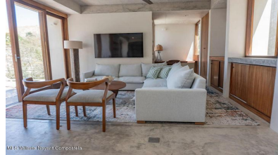
MIS Vallarta Nayait Compostela