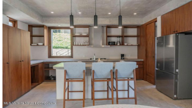
MIS Vallarta Nayait Compostela