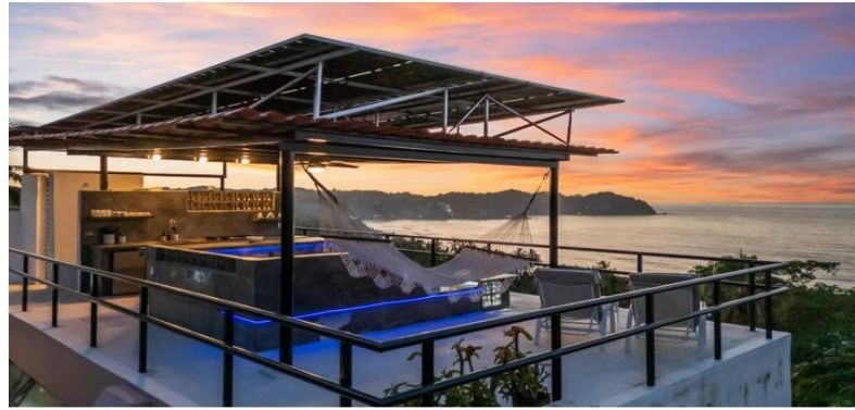
MI S Vallarta Nayarit Compostela