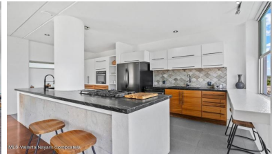
MI S Vallarta Nayarit Compostela