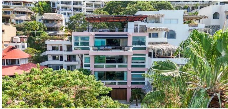
MI S Vallarta Nayarit Compostela