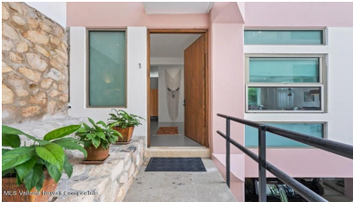
MI S Vallarta Nayarit Compostela