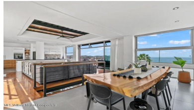
MI S Vallarta Nayarit Compostela