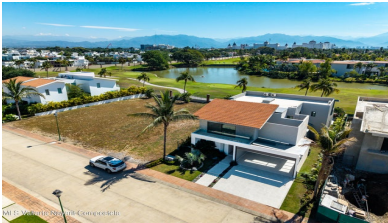
MIS Vallarta Nayarit Compostela