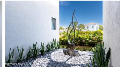
MIS Vallarta Nayarit Compostela