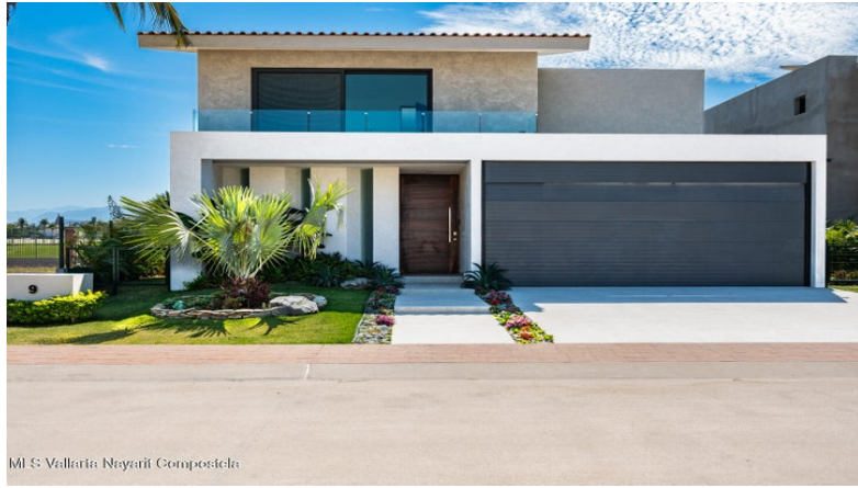
MIS Vallarta Nayarit Compostela