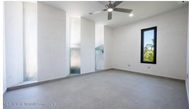
MIS Vallarta Nayarit Compostela