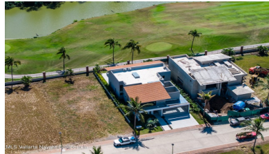
MIS Vallarta Nayarit Compostela