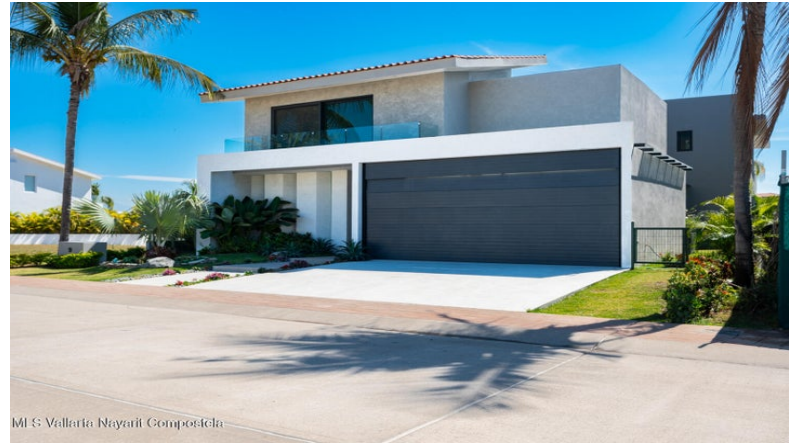
MIS Vallarta Nayarit Compostela