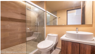
MLS Vallarta Nayariit Compostela