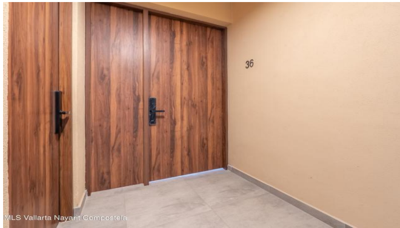
MLS Vallarta Nayariit Compostela