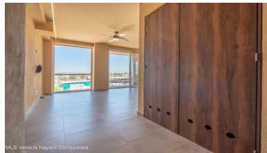
MLS Vallarta Nayariit Compostela