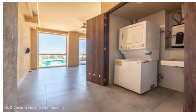
MLS Vallarta Nayariit Compostela