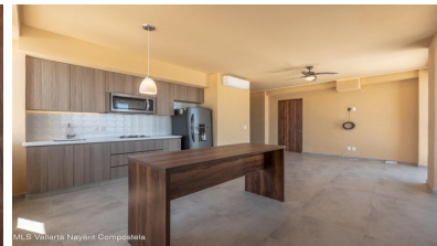
MLS Vallarta Nayariit Compostela