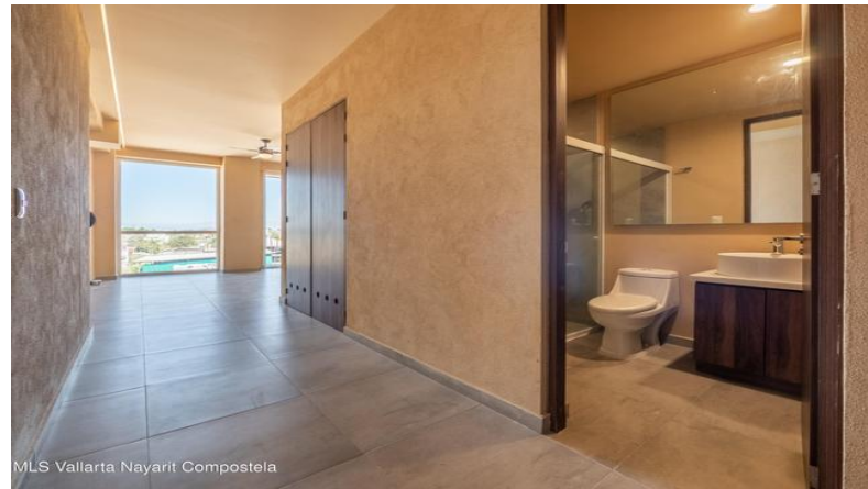
MLS Vallarta Nayariit Compostela