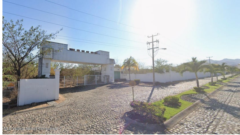
Acceso y bardeado perimetral