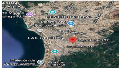
MI 51 Vallarta Nayarit Compostela