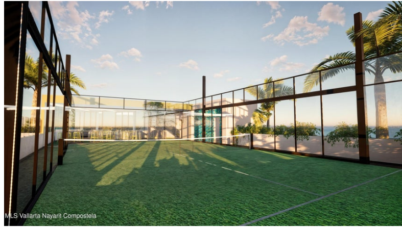
M.S Vallarta Nayarit Compositeda