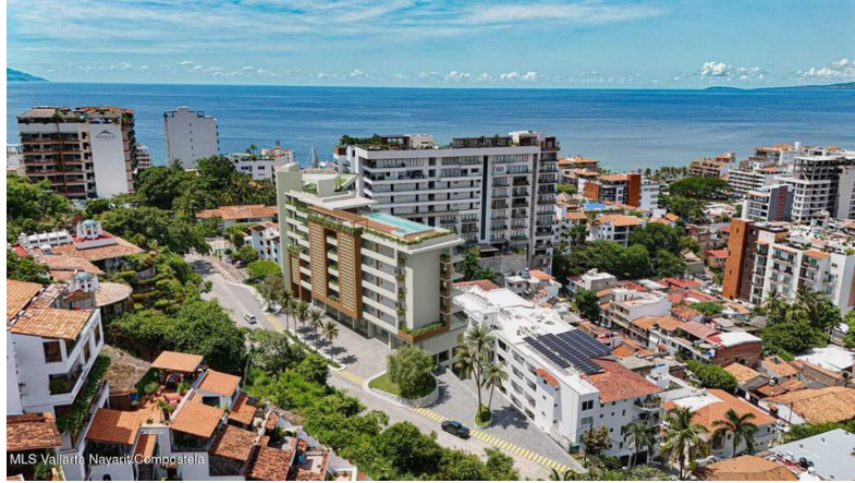
MLS Vallarta Nayarií Compostela