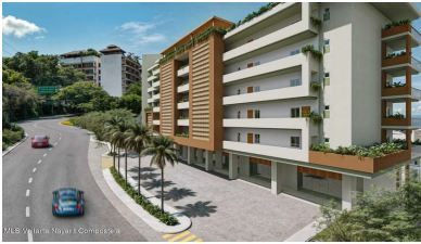
MLS Vallarta Nayarií Compostela