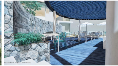
MLS Vallarta Nayarií Compostela