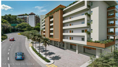
MLS Vallarta Navarri Compostela