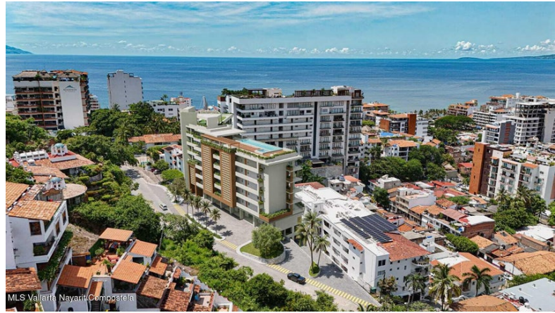
MLS Vallarta Navarri Compostela