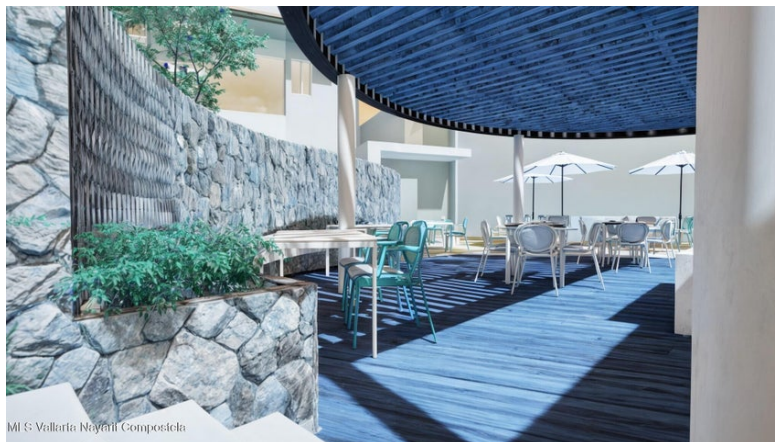
Mi S Vallarta Mayanil Compositela