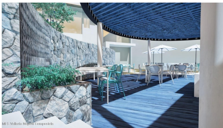
Mi S Vallarta Naymih Compostela