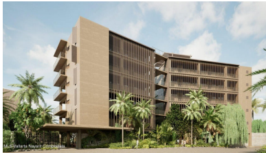
MI S Vallarta Nayarit Compostela