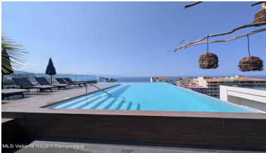
MIS Vallarta Nayari Compostela