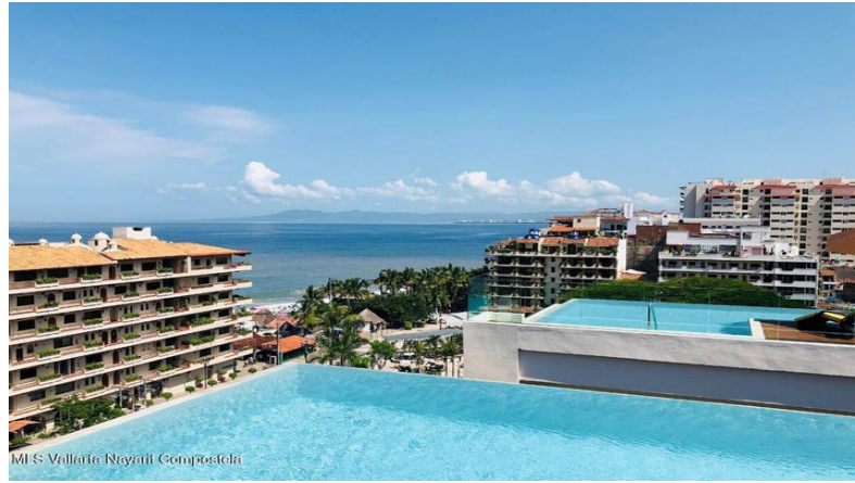
MIS Vallarta Nayari Compostela