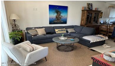
MIS Vallarta Nayari Compostela