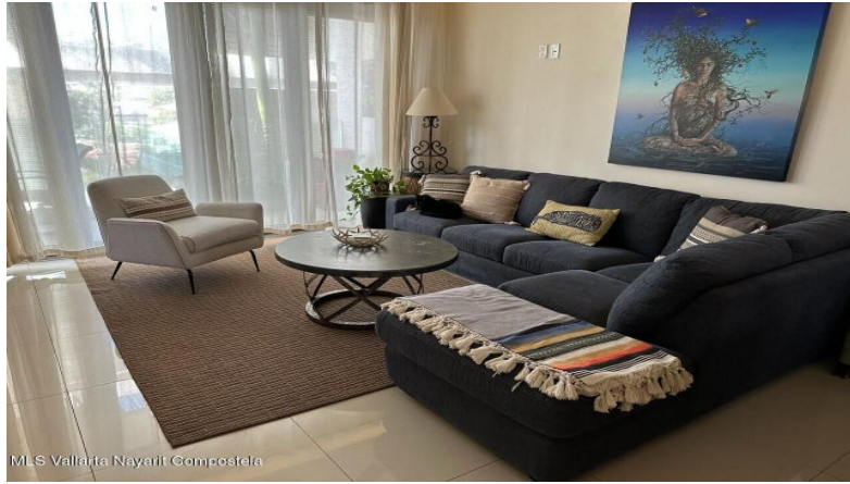
MIS Vallarta Nayari Compostela