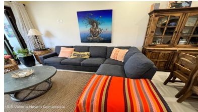
MIS Vallarta Nayari Compostela