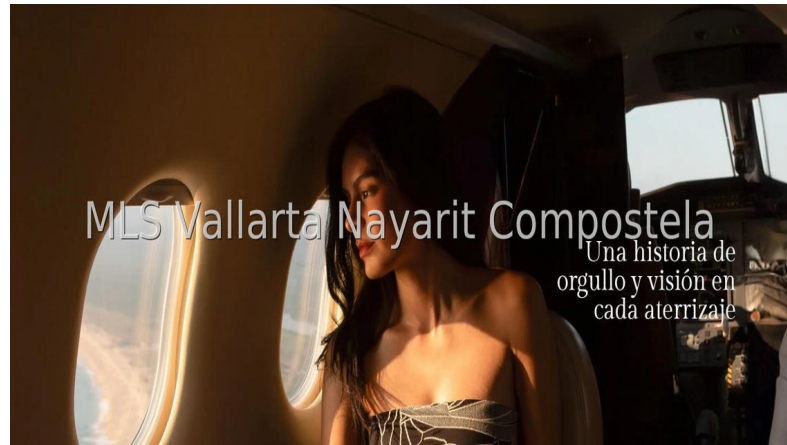
MLS Vallarta Nayarit Compostela Una historia de orgullo y visión en cada aterrizaje