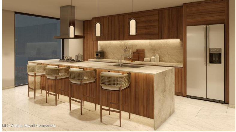
MI S Vallarta Mayari Compositela