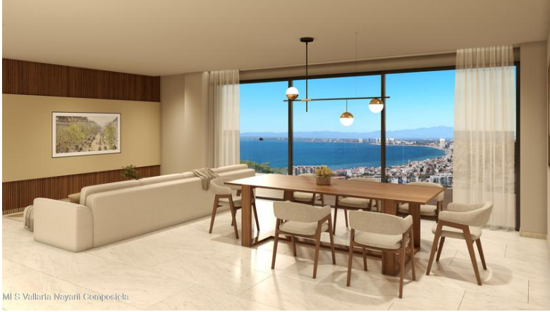
MI S Vallarta Mayari Compositela