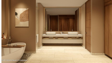
MI S Vallarta Mayari Compositela