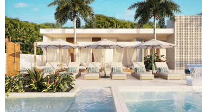
MI S Vallarta Mayari Compositela