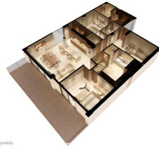
MI S Vallarta Mayari Compositela