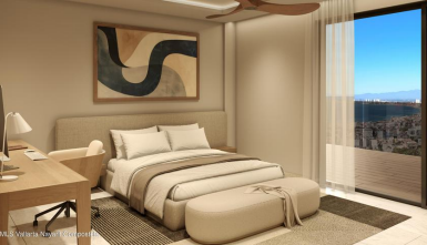
MI S Vallarta Mayari Compositela