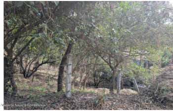
MI S Vallarta Navarri Compostela