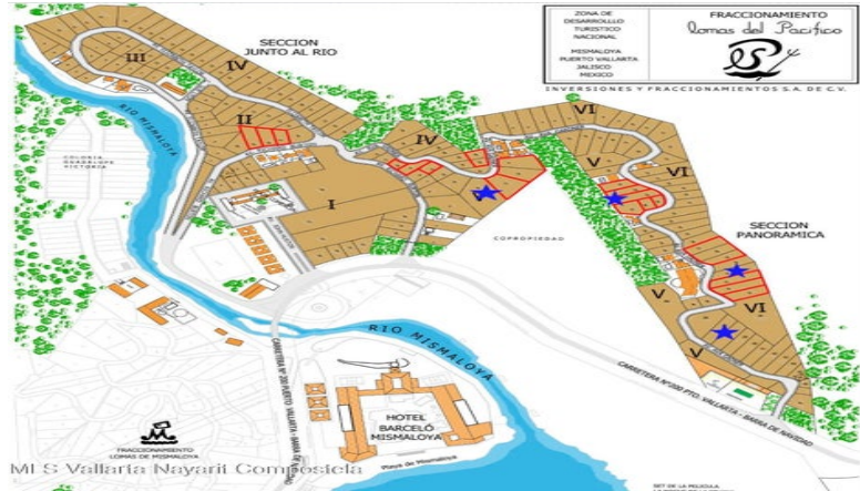
MI S Vallarta Nayarit Compostela

LOMAS DEL PACÍFICO NATURE'S RETREAT Lote 18 M-II 517.18 m 2 Uso de Suelo: H1 (5)