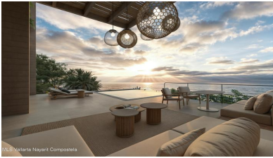
M/S Vallarta Nayarit Compostela