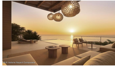
M/S Vallarta Nayarit Compostela