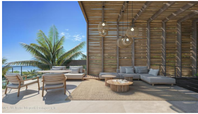
M/S Vallarta Nayarit Compostela