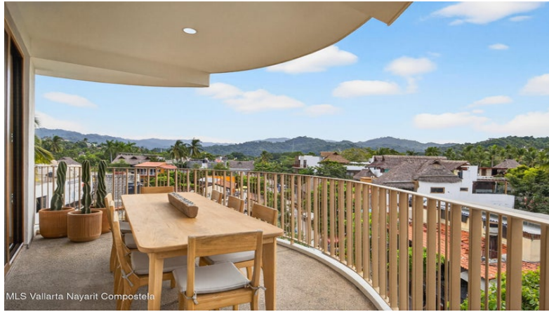
MLS Vallarta Nayariit Compostela