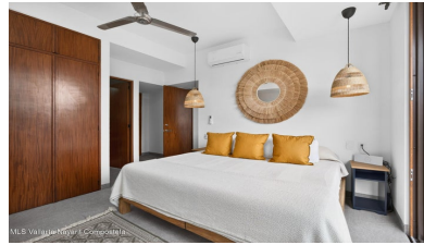
MLS Vallarta Nayariit Compostela