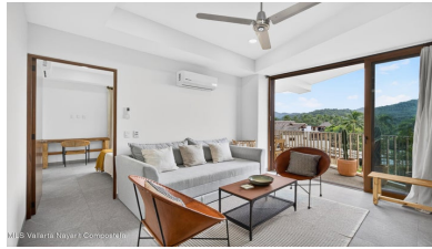
MLS Vallarta Nayariit Compostela