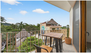
MLS Vallarta Nayariit Compostela