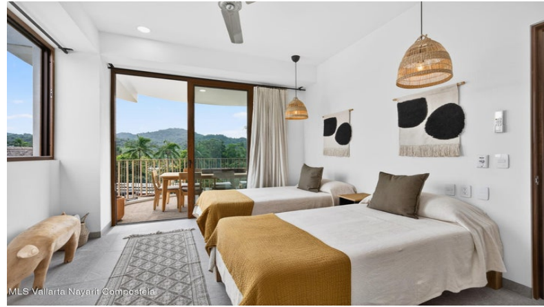
MLS Vallarta Nayariit Compostela