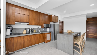
MLS Vallarta Nayariit Compostela