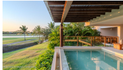
M/S Vallarta Nayarit Compostela