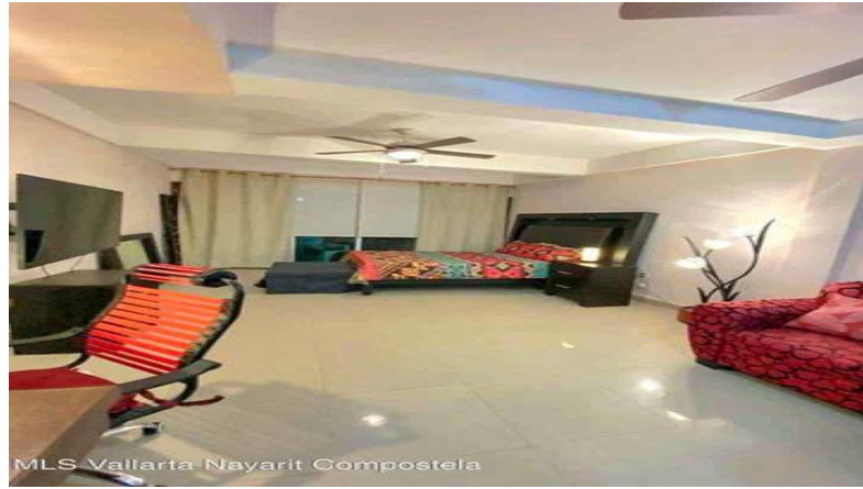
MLS Vallarta Nayariit Compostela