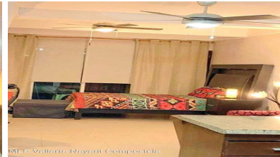
MLS Vallarta Nayariit Compostela