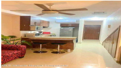
MLS Vallarta Nayariit Compostela