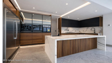
MLS Vallarta Nayarit Compoctela