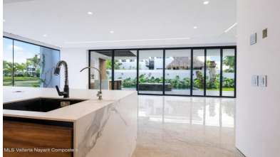
MLS Vallarta Nayarit Compoctela