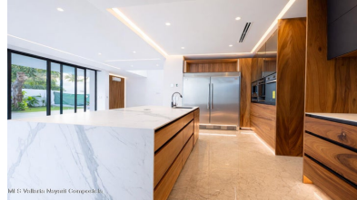
MLS Vallarta Nayarit Compoctela