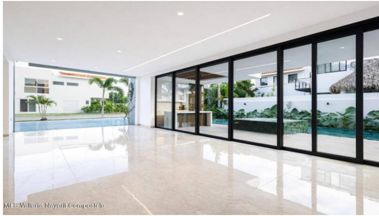
MLS Vallarta Nayarit Compoctela