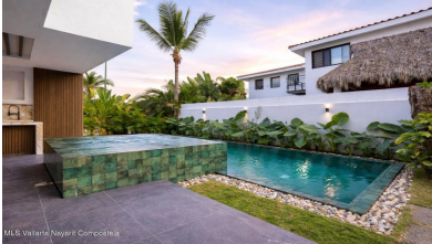
MLS Vallarta Nayarit Compoctela