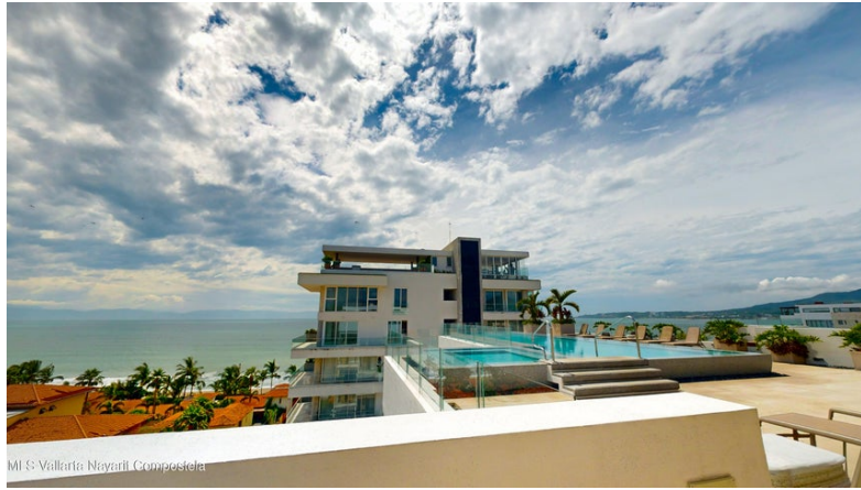
MI S Vallarta Nayari Compostela