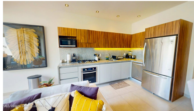
MI S Vallarta Nayari Compostela