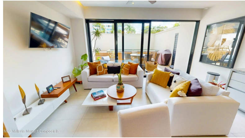
MI S Vallarta Nayari Compostela