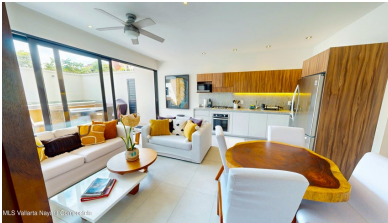
MI S Vallarta Nayari Compostela