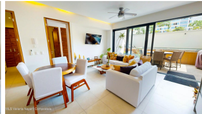
MI S Vallarta Nayari Compostela