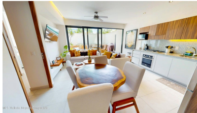
MI S Vallarta Nayari Compostela